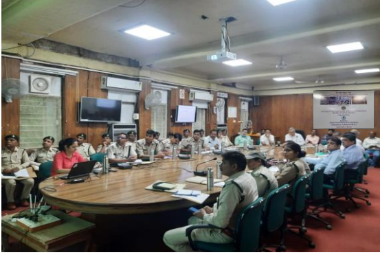
प्रशिक्षण कार्यक्रम में विषय विशेषज्ञों द्वारा व्याख्यान