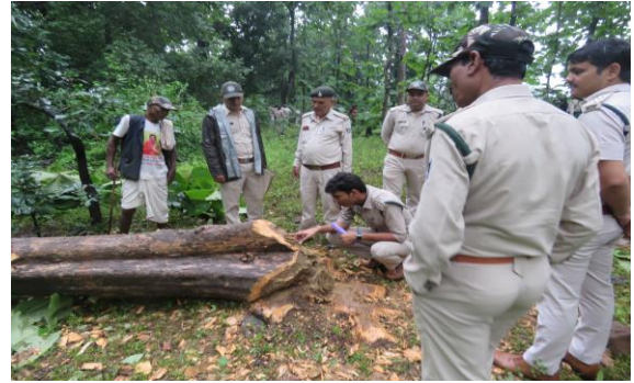
प्रशिक्षणार्थियों द्वारा टूठ ड्रेसिंग विधि पर अध्ययन