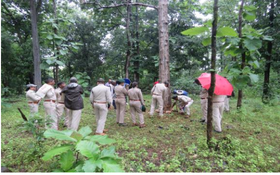
मंडला वनमंडल उत्पादन के कूप में प्रायोगिक प्रदर्शन