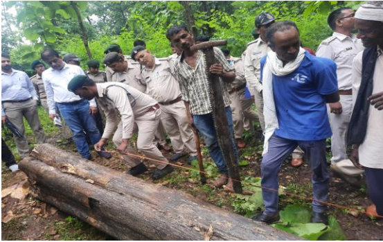
विषय विशेषज्ञों द्वारा लॉगिंग विधि पर मार्गदर्शन