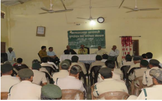
प्रशिक्षण कार्यक्रम का समापन सत्र