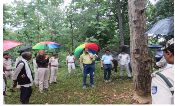
विषय विशेषज्ञों द्वारा पातन विधि पर मार्गदर्शन