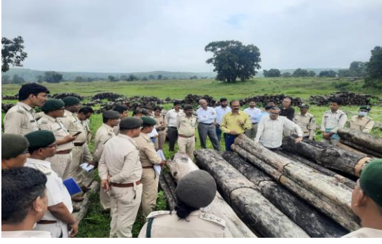
मंडला वनमंडल उत्पादन के कालपी काष्ठागार में प्रायोगिक प्रदर्शन