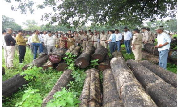
कालपी काष्ठागार में ग्रेडिंग विधि पर विषय विशेषज्ञों द्वारा मार्गदर्शन