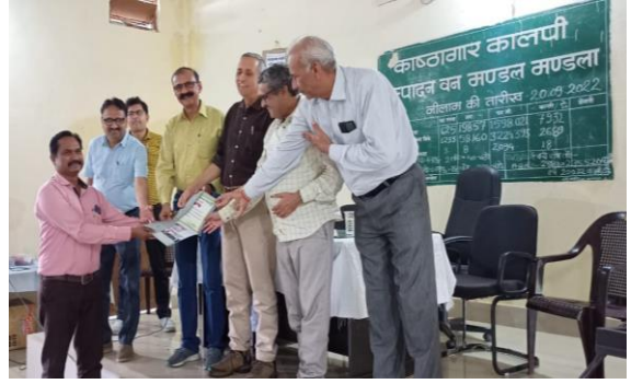
प्रशिक्षणार्थियों को प्रमाणपत्र वितरण